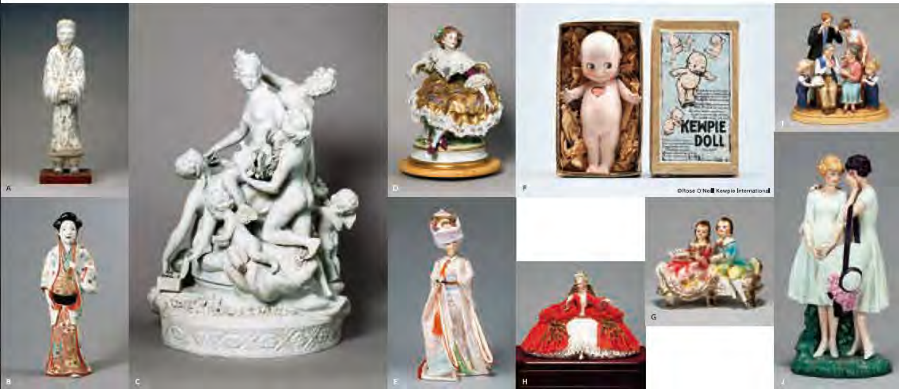
A 加彩人物俑 中国 前漢時代 前2世紀 愛知県陶磁美術館蔵 B 色絵美人人形置物 有田・柿右衛門様式 江戸時代中期 18世紀 愛知県陶磁美術館蔵 C ビスキュー「ヴィーナスの化粧」セーブル フランス 19世紀末頃 愛知ポーセリンミュージアム蔵 D 「椅子にかける乙女」フォルクシュタット ドイツ 19世紀末頃 愛知ポーセリンミュージアム蔵 E 「花嫁人形」加藤徳松(テークー製陶所) 瀬戸 昭和20年代 瀬戸ノベルティ文化保存研究会蔵 F キュービー人形 ドイツ 1913年頃 株式会社ロースオニール キュービー・インターナショナル蔵 G 「見つめ！」レース人形(白雲陶器) 池田丸日製陶 瀬戸 昭和30年頃(1955頃) 株式会社IMARUYO(旧・池田丸日製陶)蔵 H 「アン女王」テークー名古屋人形製陶 瀬戸 平成23年(2011) テークー名古屋人形製陶株式会社蔵 I 子供人形「デニム・デイズ」愛新陶器 瀬戸 昭和時代 株式会社愛新陶器蔵 J 「ねえ、聞いてよ」山国製陶所 瀬戸 1980～1990年代 瀬戸ノベルティ文化保存研究会蔵

陶磁器を素材とした人形(ひとがた)の塑像「陶製人形」は、洋の東西を問わず古代から制作され、世界中で愛玩されてきました。古くは中国で紀元前につくられた陶製の人物俑(よう)、また、日本では土偶(どぐう)や埴輪(はにわ)といった陶製人形がありました。人形制作の伝統は引き継がれながら、土人形などもつくられました。中でも、中国の徳化窯で作られた磁器製人形はヨーロッパに渡り、フィギュリン制作に大きな影響を与えました。こうした流れを受けながら愛知県瀬戸市でも対外輸出用の陶製人形—いわゆる「ノベルティ人形」の制作がはじまり、今年で100年を迎えます。本展覧会では、世界の陶製人形の制作の源流をたどって、紀元前の中国、日本、ヨーロッパなどのさまざまな時代の陶製人形とともに、今日まで続く「Made in 瀬戸のノベルティ」の魅力を紹介します。